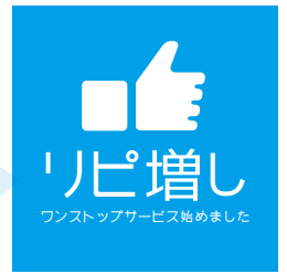
←ロイヤルカスタマー(AA顧客:優良顧客)